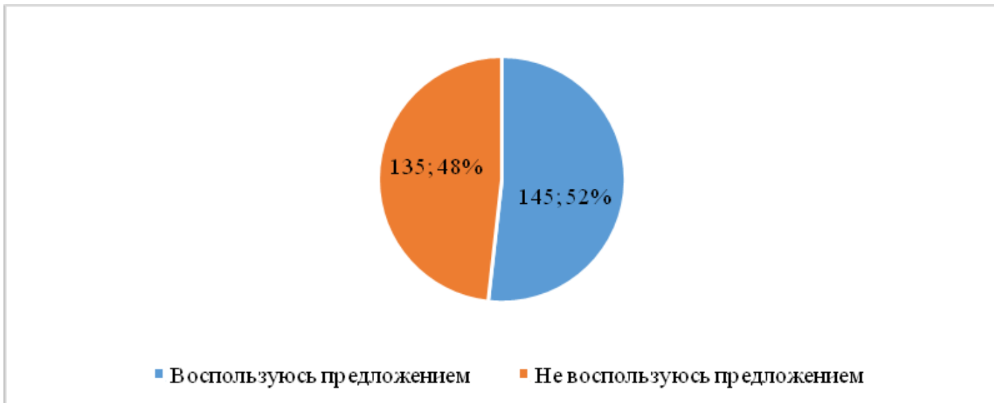
Рисунок 2.1 - Распределение ответов респондентов, чел.

Таким образом, 145 человек на заданный вопрос ответили утвердительно, что позволяет спланировать финансовый результат по данному кредитному продукту для Череповецкого отделения ПАО «Сбербанк» № 1950.